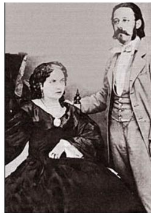
Novomanželé Bettina a Bedřich Smetanovi, 'Obřívství 10. července 1860