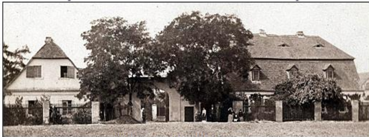
Lamberk na historické fotografii, archiv Muzeum Bedřicha Smetany, Praha

http://www.obristvi.cz/fotogalerieH_lamberk.htm