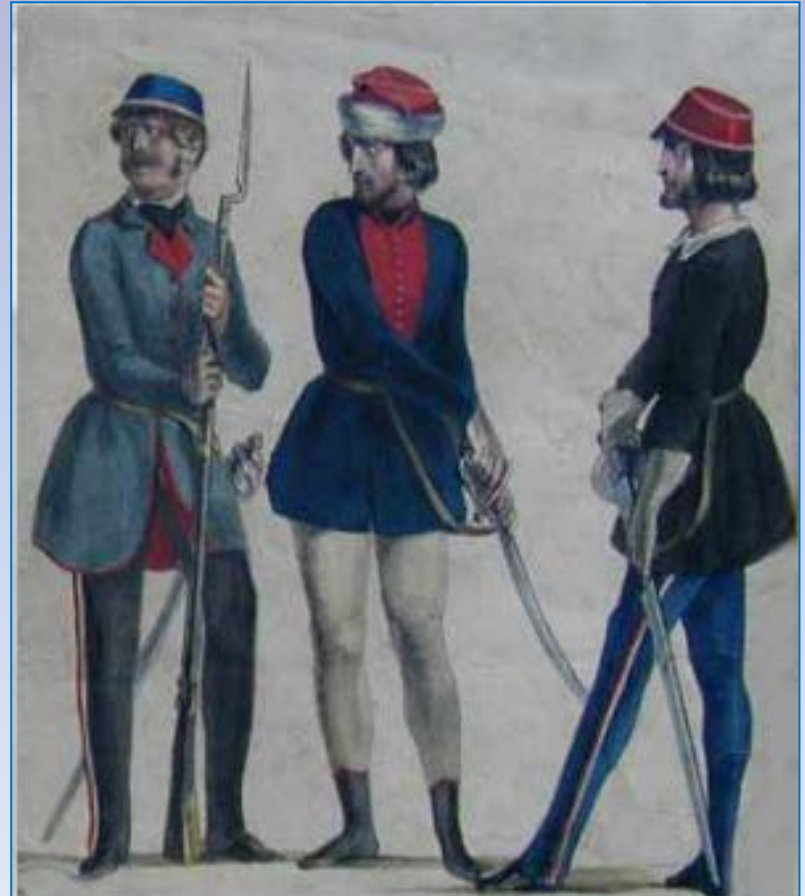
Návrhy uniforem národní gardy, grafický list, 1848