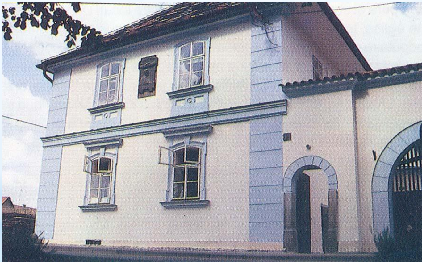
Rodný dům Antonína Dvořáka V Nelahozevsi

http://www.nelahozeves.cz/index.php?nid=1524&lid=cs&oid=158882