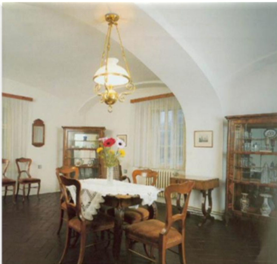
Interiér památníku - pohled do měšťanského pokoje. Expozice se nachází v rodném domě Antonína Dvořáka v Nelahozevsi.