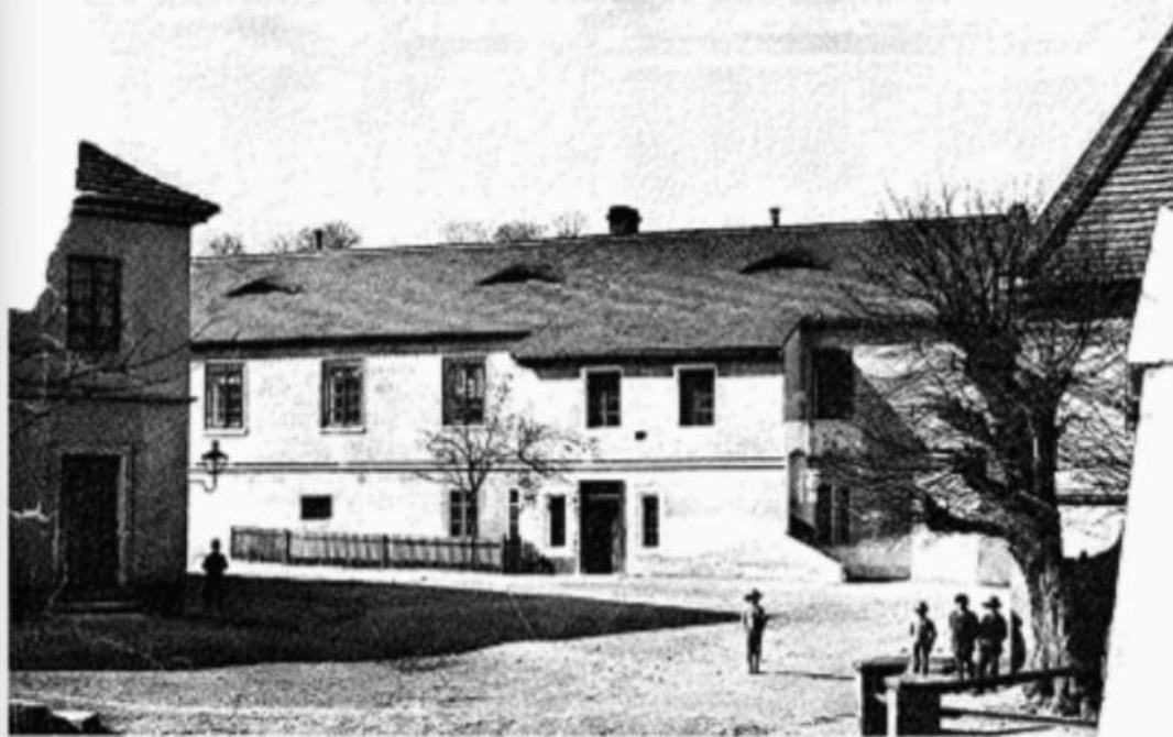
Stará škola v Nelahozevsi (na snímku uprostřed)

Tady začal malý Antonín Dvořák navštěvovat školu. Byla to jednotřídka. Pan učitel ho začal učit hrát na housle.