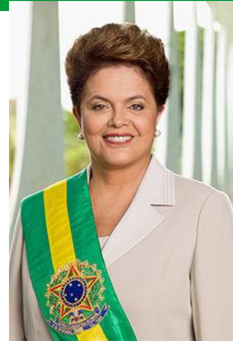
Brazílská prezidentka Dilma Rousseff (1. žena v čele Brazílie)