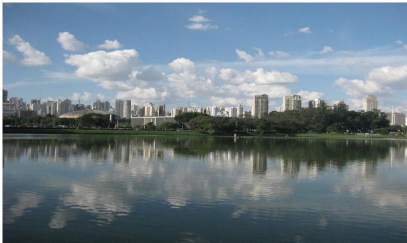
Největší park v São Paulu - Ibirapuera