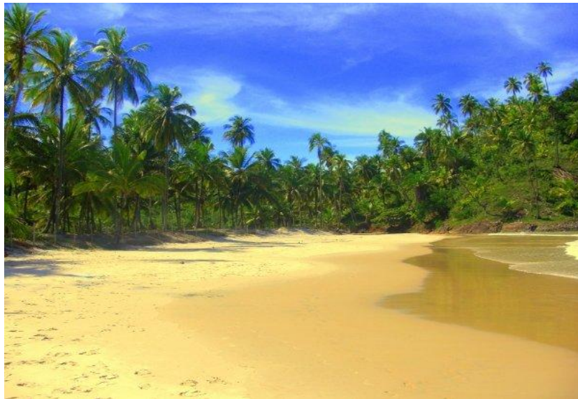
Pláž u surfařského městečka Itacaré