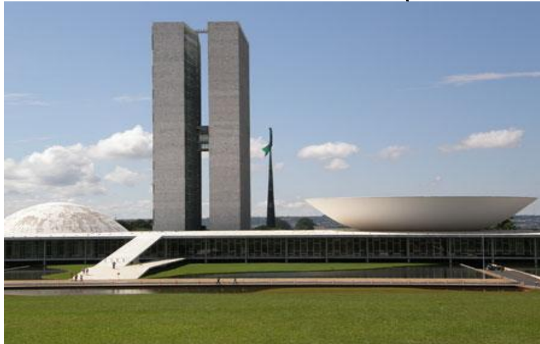
Budova parlamentu v hl. městě Brasíliá