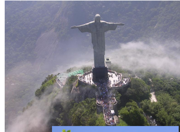
Socha Krista Spasitele na hoře Corcovado