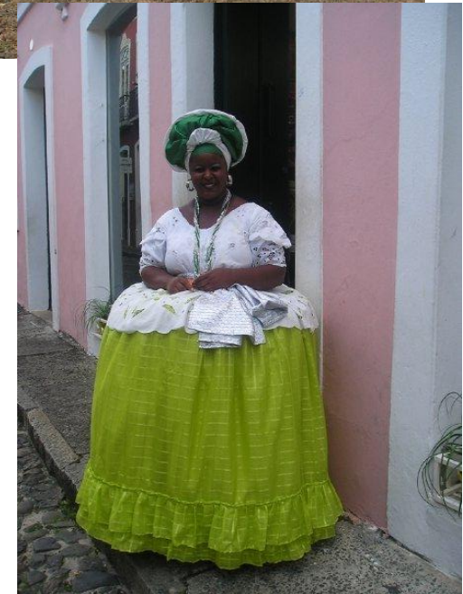
Žena v Salvadoru oblečená do tradičních šatů