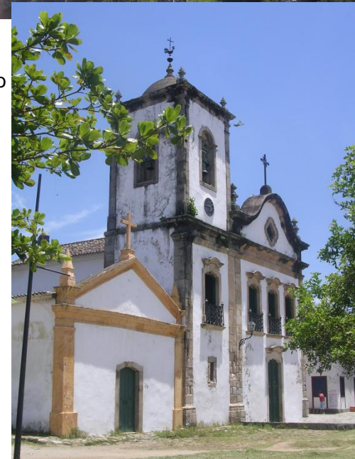
Kostel v koloniálním městečku Paraty poblíž Rio de Janeira