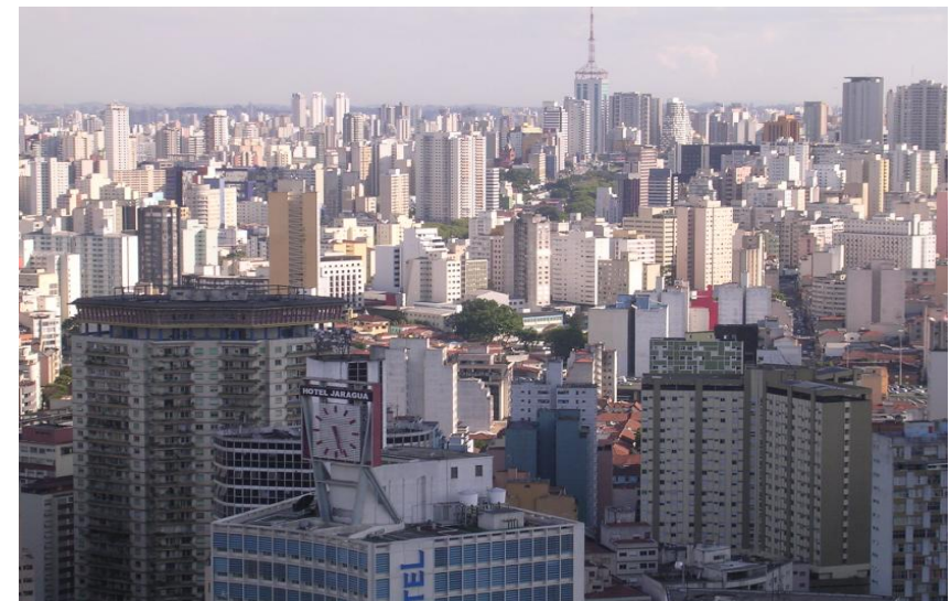
Pohled na megalopoli São Paulo