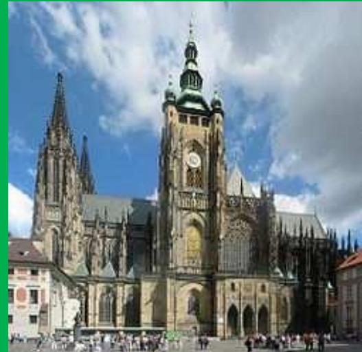
Chrám sv. Víta