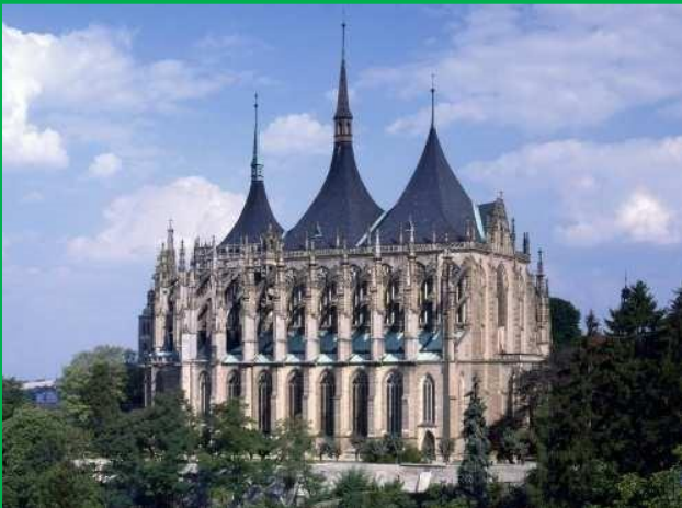
Chrám sv. Barbory v Kutné Hoře